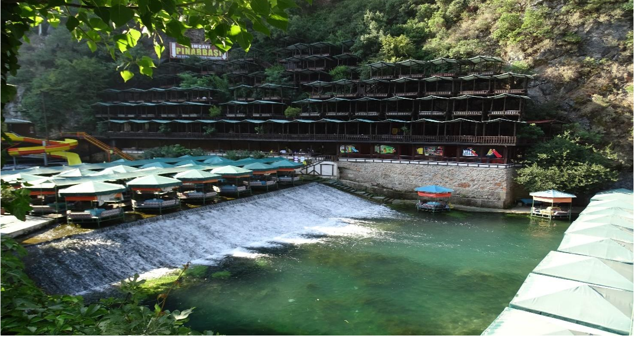
Foto2. Alacami Mahallesi.

sebepl olmuştur. Özellikle Dim Çayı üzerine kurulu sosyal tesisler oldukça rağbet görmektedir. Vadi içerisinde 40 civarı tesis bulunmaktadır. Günümüzde pek çok aile geçimini turizmden sağlar hale gelmiştir.