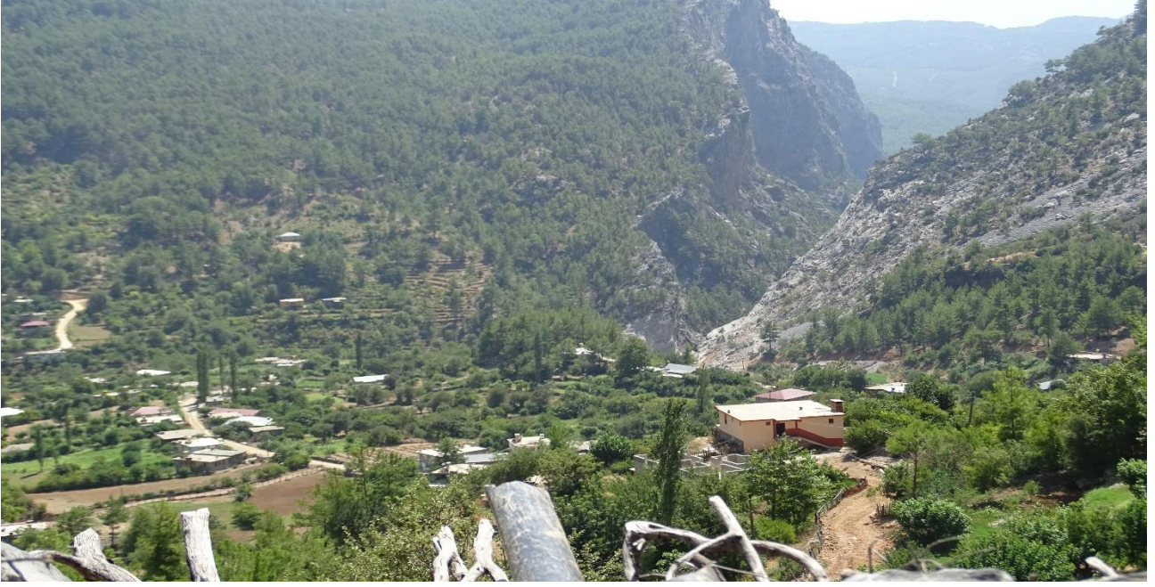
Foto 1. Alacami Mahallesi.