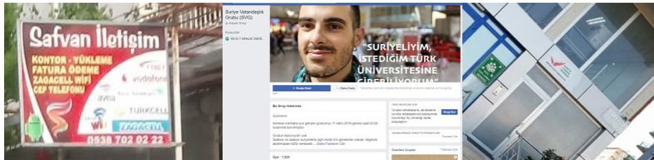
Foto 4: Suriyeli mültecilerin iletişim, sosyal medya ve yardımlaşma kanalları

İletişim ve medya bağlamında ise Suriye kökenli telefon operatörünün kullanıldığı ayrıca Suriye'nin Radyo ve TV kanallarının izlendiği gözlenmektedir. Sosyal medyada Suriyelilere yönelik evlilik, arkadaşlık sitelerinin yanı sıra ve sosyal medya üzerinden yardımlaşma grupları kurdukları görülmektedir.