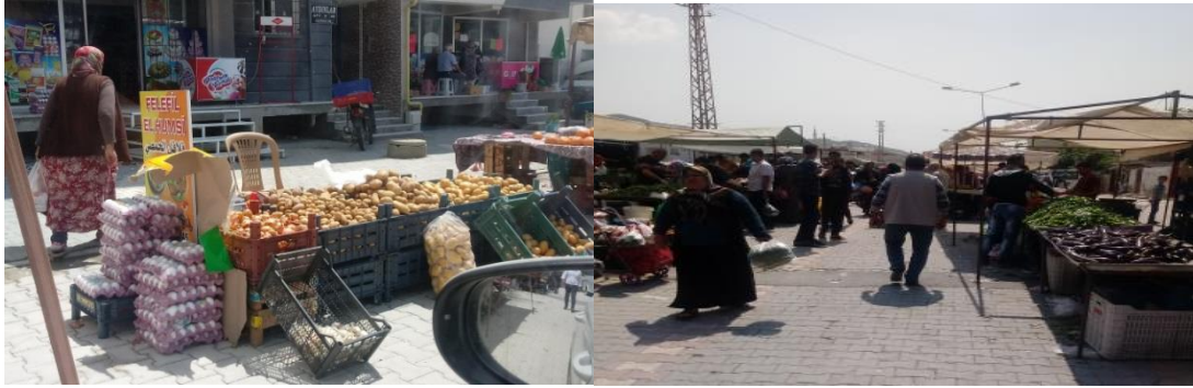
Foto 3: Ekinci ve Narlıca mahallerindeki semt pazarından bir görünüm

Pazar pratiği bağlamında, pazarlara getirdikleri ürünleri yerli halka nazaran daha düşük fiyatlara sattıkları için hedef alıcı kitlesinin Suriyelilerin yanı sıra, yerli halktan da oluştuğunu gözlemlemek mümkündür. Suriyeli mülteciler, semt pazarlarında satışa sundukları tarımsal ürünleri kendileri yetiştiriyorlar, bunun yanı sıra kendilerine ait işlettikleri marketlerde Suriye'den getirilen malları satışa sunuyorlar. Nitekim köken ülkeden getirilen ürünler daha düşük maliyete sahip olduğundan, Suriyeli mülteciler için bu durum daha yüksek bir kar elde etme imkânı sunmaktadır.