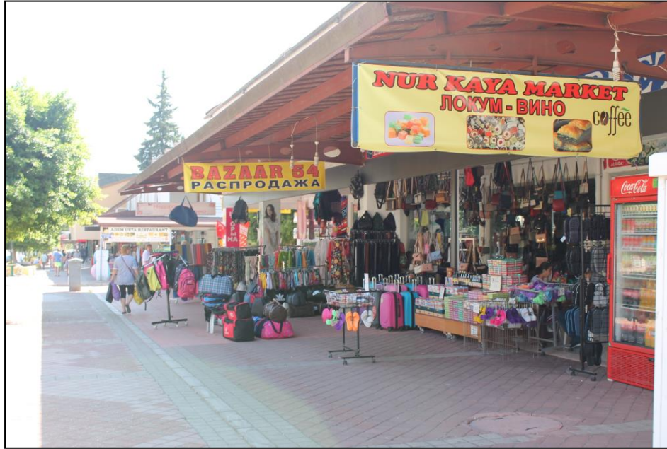
Foto 2.Kemer'deki turistik dükkânlardan görünüm