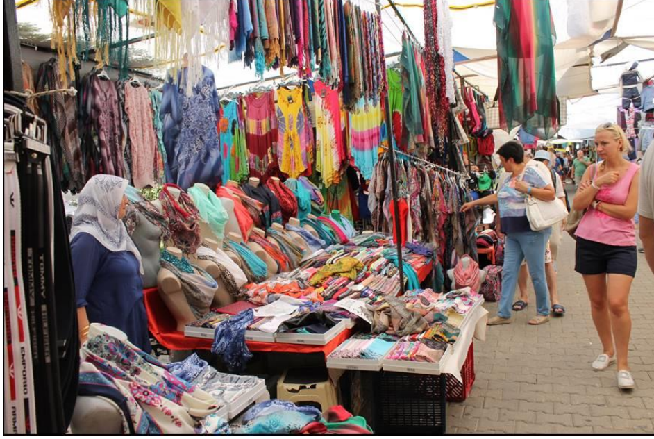
Foto 1.Kemer'deki Turistik Pazarlardan görünüm