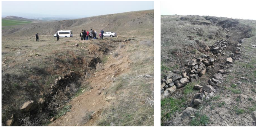
Foto 16-17: Türk Ordusunun “Son savunma hattı” olan Basrikale Tepe mevzileri

Basrikale Tepe Mevzileri, Basrikaletepe Polatlı meskûn mahalinin 10 km. batısında; Duatepe’nin 3 km. doğusunda yer almaktadır. Burası bir bakıma Türk ordusunun son savunma hattıdır. Yani aslında Türklerin 2. Viyana Kuşatması’ndan itibaren başlayan geri çekilme süreci bu hatta son bulmuştur.