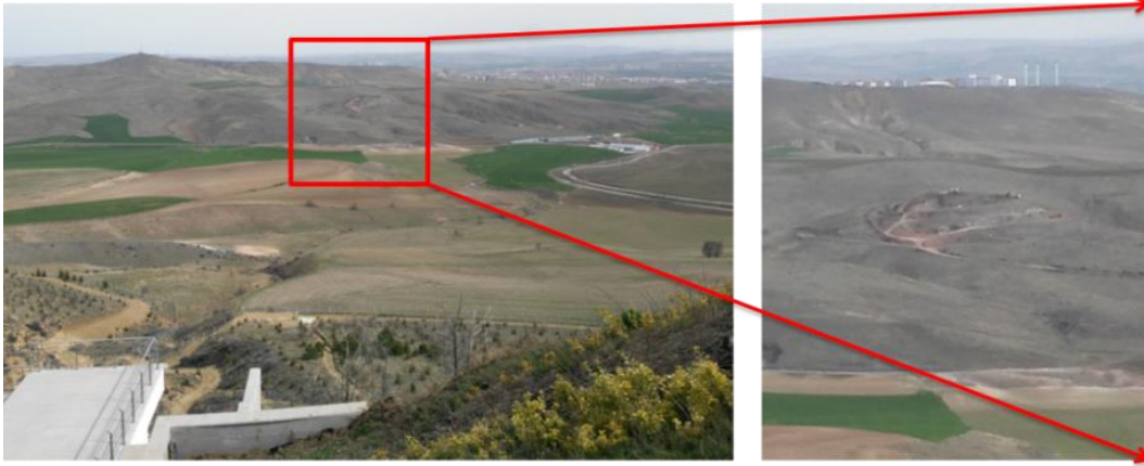
Foto 14-15: Duatepe’den “Son savunma hattı” olan Basrikale Tepe mevzilerinin ve arkasında Polatlı İlçesinin görünümü

17 Mart 2018 tarihinde 3. defa alana gidildiğinde de Tarihi Milli Parkla ilgili yerinde gözlemler yapılmış ve bulgular elde edilmiştir. Türk ordusunun “Son savunma hattı” olan Basrikale Tepe’deki kazı çalışmalarının halen durmaksızın devam ettirildiği görülmüş ve bu durum; gerek Türk genel karşı taarruzunda düşmandan geri alınan ilk tepe olan Duatepe’den gerekse “Son savunma hattı” olan Basrikale Tepe mevzilerinin içerisinde görülmüştür (Foto 14-15-16-17).