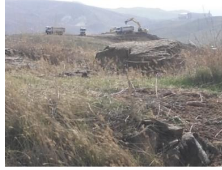
Foto 18-19: Türk ordusunun "Son savunma hattı" olan Basrikale Tepe mevzilerinden hemen yakınındaki kazı çalışmalarının görünümü