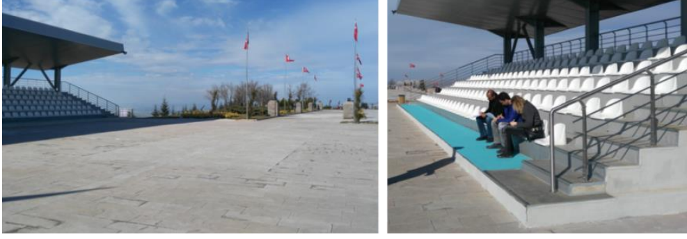
Foto 12-13: Anma törenleri için düzenlenen oturma yerleri ve ziyaretçilerle yapılan anket çalışmasından bir görünüm.

17 Mart 2018 tarihinde 3. defa alana gidildiğinde de Tarihi Milli Parkla ilgili yerinde gözlemler yapılmış ve bulgular elde edilmiştir. Türk ordusunun “Son savunma hattı” olan Basrikale Tepe’deki kazı çalışmalarının halen durmaksızın devam ettirildiği görülmüş ve bu durum; gerek Türk genel karşı taarruzunda düşmandan geri alınan ilk tepe olan Duatepe’den gerekse “Son savunma hattı” olan Basrikale Tepe mevzilerinin içerisinde görülmüştür (Foto 14-15-16-17).