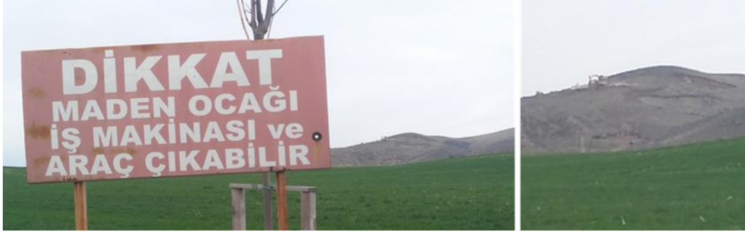
Foto 8-9: Basrikale Tepe Mevzilerinde gerçekleştirilen kazı çalışması ve yol üzerindeki “Maden Ocağı !” tabelası.

Duatepe Anıtı'na giden yol üzerinde Necmettin Halil Onan'ın Çanakkale Savaşı ile özdeşleşen “Bir Yolcuya” şiirinin sözleri tanıtım panolarına yazılmıştır. Bu panolar alana giden ziyaretçilere buradaki milli parkın tarihi özelliğini vurgulamaktadır.