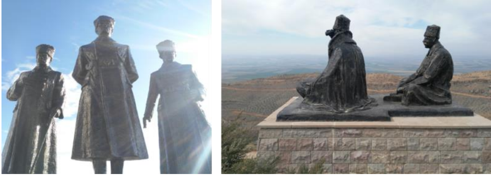
Foto 10-11: Solda Duatepe Zafer Anıtı (Fevzi Çakmak, Gazi Mustafa Kemal, İsmet İnönü), sağda “Muharebeyi dürbünle izleyen Mustafa Kemal” heykeli