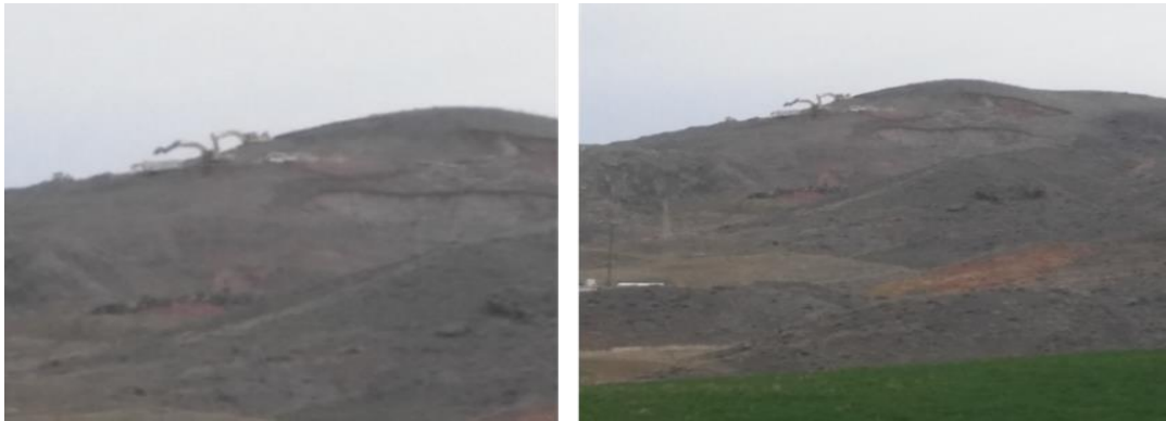
Foto 6-7: 11 Mart 2018 tarihinde Basrikale Tepe'de sürdürülen kazı çalışmalarının durumu

Duatepe'ye ulaşmak için Türk Kurtuluş Savaşı'nın dönüm noktasına tanıklık etmiş ve koruma altına alınmış bölgede ilerlerken; yol kenarındaki "Dikkat Maden Ocağı İş Makinası ve Araç Çıkabilir" yazılı tabelanın yer alması geçmişten bugüne bu alanlara ne denli sahip çıkılmış olduğunu bir kez daha gözler önüne sermektedir (Foto 8-9).