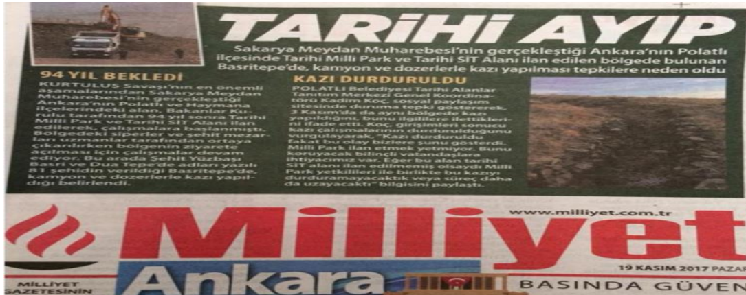
Foto 1. 19 Kasım 2017 tarihli Milliyet Gazetesinin Ankara ekinde Tarihi Milli Park alanlarındaki kazı çalışması ile ilgili haber.

"Bunu Maden İşleri Genel Müdürlüğü ile konuşman gerekiyor. Tarihi Sit Alanı olarak ilanı bizden sonra ve durdurma kararını o dönemde Kültür Varlıkları ve Müzeler Genel Müdürlüğü alırdı. Milli Parkın ilanından önce alınmış olan mevzilerin ruhsat süreleri geçerli. 2009'da ruhsatını almışlar. 2019'a kadar ruhsatları varmış. 2019'a kadar mevzuatımıza göre biz Milli Parklar olarak müdahale edemiyoruz." demişlerdir.