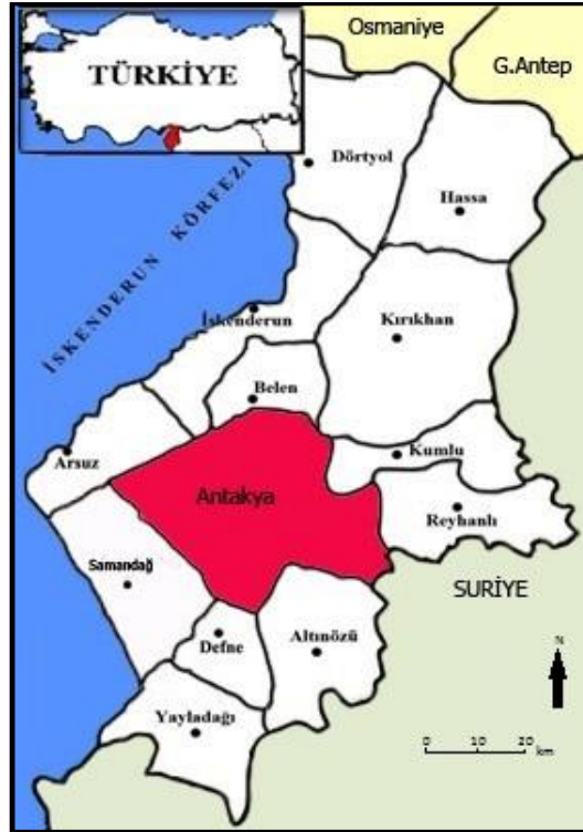
Harita 2: Çalışma sahasının lokasyonu.

Akdeniz’in doğu ucunda yer alan ve bir sınır ili olan Hatay, 5403 km 2 ’lik yüzölçümü ile 35° 52’ ve 37° 04’ kuzey enlemleriyle, 35° 40’ ve 36° 35’ doğu boylamları arasında yer almaktadır. İl, doğu ve güneyde Suriye, kuzeydoğuda Gaziantep’in İslahiye ilçesi, kuzey ve kuzeybatıda Adana ve Osmaniye illeri, batıda da İskenderun Körfezi ile çevrilidir. Büyük Şehir Belediyesi olmadan önce Hatay’ın merkez ilçesi konumunda olan Antakya ise batıda Arsuz ve Samandağ, güneyde Altınözü ve Defne, doğuda Kumlu ve Reyhanlı, kuzeyde Belen, Kırıkhan ve İskenderun ilçeleri ile çevrilidir (Harita 2). Tektonik bir graben alanında bulunan Antakya Habibi Neccar dağının eteklerinden ovaya doğru genişleyen bir yerleşim sahası üzerinde bulunmaktadır.