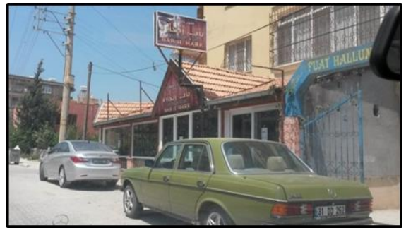
Foto 2: Suriyeli Sığınmacıların kendi imkânlarıyla kurmuş olduğu bir işletme (Aksaray).

İşletmelere verilen isimler hemen tamamen sığınmacıların kendi dilleri ve kültürlerinin ürünü (Bab-il Hara= Mahalle Kapısı, Homs= Suriye'de bir kent ismi) olarak ortaya çıkmakta ve bu durum kültürün insanla beraber göç ettiğinin bir kanıtını oluşturmaktadır. Sığınmacılar kendi imkânlarıyla açmış olduğu işletmeler kimi zaman kazanç durumuna bağlı olarak faaliyetini sürdürmektedir (Foto 3).