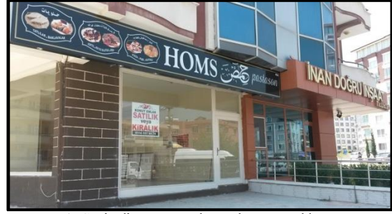
Foto 4: Suriyeli sığınmacıların kurmuş olduğu ve kapatılan bir işletme (Saraykent).

Sosyal ve Mekânsal Aidiyet; her ne kadar sığınmacılar kendilerini yerleştikleri mekana ait olarak görmeye çalışsalar da bunu başaramadıklarını söylemek mümkündür. Nitekim terk ettikleri mekan ile yerleştikleri mekan arasında yaşam tarzı farklılığı, kültürel ve sosyal farklılıklar bulunmakta ve bunlara uyum sağlamak sığınmacılar için büyük zorluklar oluşturmaktadır. Zira bunu başarmak için ilk önce kendi kültürlerini ve yaşam tarzlarını unutmaları veya değiştirmeleri gerekmektedir, ancak bu kolayca uygulanabilecek bir seçenek olmamaktadır. Geri Dönüş-Kalıcılık; sığınmacıların önemli bir kısmı savaş ortamının ve buna bağlı yaşadıkları travmaların hala belleklerinde izler bırakmasından dolayı kendi ülkelerine geri dönmeyi düşünmemektedirler. Bir kısmı koşullu olarak geri dönmeyi düşünürlerken bir diğer kısmı ise zorunlu nedenlerle geri dönüşü düşünebileceklerini ifade etmişlerdir. Özellikle kendi ülkelerinde yaşanan savaşın sona ermesi ve hayatın normal seyrine dönmesi durumunda geri döneceklerini belirtenlerin yanında Türkiye'nin sığınmacıları zoraki olarak geri dönmek ile karşı karşıya bırakması durumunda geri dönebileceklerini belirtmişlerdir.