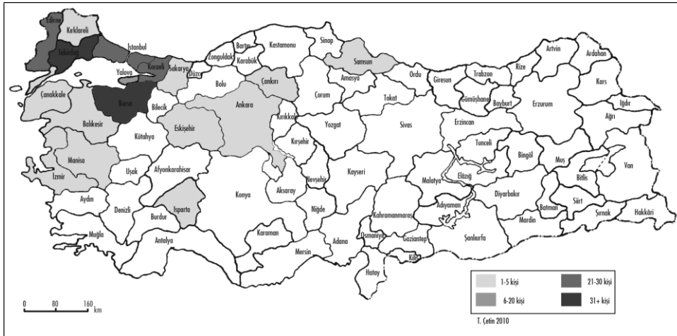
Şekil 2. Katılımcıların Türkiye'ye göç ettiklerinde ilk olarak yerleştikleri illere göre dağılımı

Araştırmaya katılan göçmenlerin Türkiye'ye göç ettiklerinde ilk olarak yerleştikleri illere göre dağılımı Şekil 2'de gösterilmiştir. Buna göre katılımcıların ilk yerleştikleri illerin başında Bursa ve Tekirdağ gelmektedir.