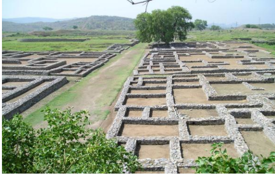
Foto 5. Sirkap şehri