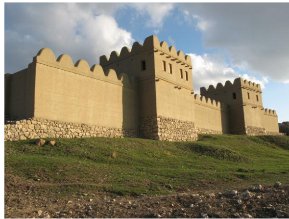
Foto 4. Hattuşa'da rekonstrüksiyonu yapılan surlar.