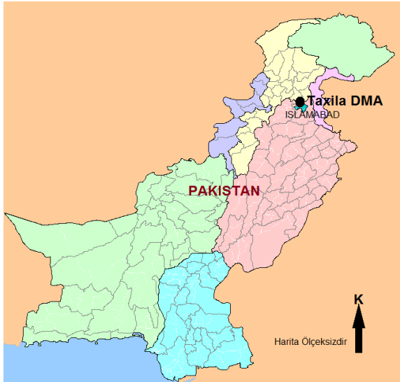
Şekil 2. Taxila'nın coğrafi konumu