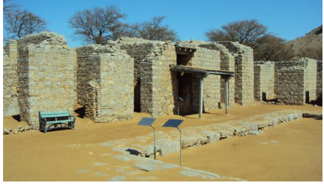
Foto 6. Julian Manastırı