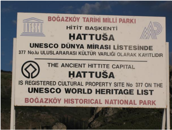
Foto 3. Hattuşa'nın UNESCO Dünya Mirası Listesinde yer aldığını belirten levha