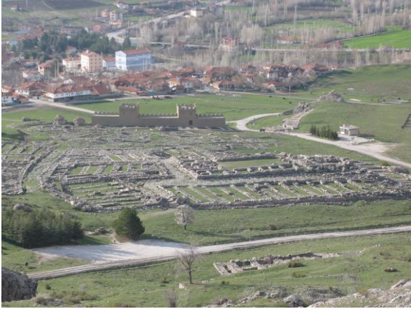
Foto 1. Hattuşa DMA ve Boğazkale İlçe Merkezi