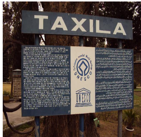
Foto 7. Taxila'nın UNESCO Dünya Mirası Listesinde yer aldığı belirten levha