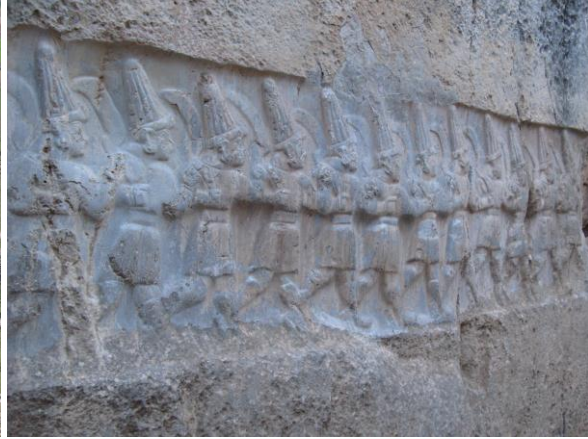
Foto 2. Hattuşa DMA'da Yazılıkaya