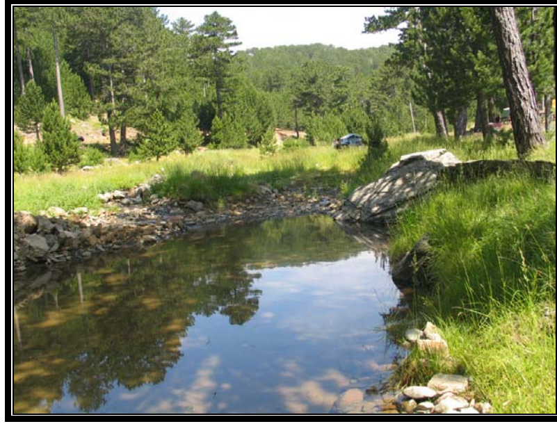
Şekil 2. Avcılar Turizmi Geliştirme Kooperatifi'nin Düden Alanı'ndaki kamping alanı

Botanik turizmi daha çok yabancılara yönelik olarak tur şirketleri tarafından organize edilmekte ve genellikle yöredeki butik oteller aracılığı ile yapılmaktadır. Kazdağı Milli Parkı içerisinde 30 civarında endemik çiçekli bitki ve yine endemik Kazdağı göknarı ( Abies equi trojani ) bulunmaktadır (Dirmenci v.d., 2007). Bu türün bulunduğu alan Kazdağı Milli Parkı'ndan ayrı olarak Kazdağı Göknarı Tabiatı Koruma Alanı adı ile korunmaktadır.