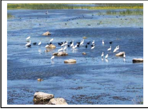
Foto 11. Gala gölü, çok sayıda su kuşunun beslenme ve barınma ortamlarından biridir.

(maks.15.528) dahil olmak üzere büyük sayıda sokuşu (maks. 48.440) kışı burada geçirir( www.turizmbakanligi.gov.tr ).