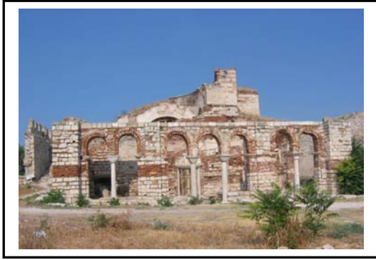
Foto 5. Fatih Camii'nin güneydoğudan görünümü.