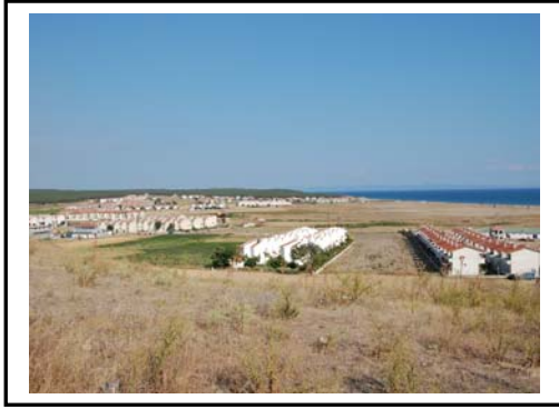
Foto 1. Sultaniçe Köyü ile Gülçavuş Köyü sahillerindeki yazlık konutlardan bir görünüm. Her iki sahilde yaklaşık 3000 konut faaliyet göstermektedir.

Sivilingrat-Kapıkule arasında Bulgaristan-Yunanistan sınırını; Karaağaç dışında ise Kapıkule'yle Enez arasında Türkiye ile Yunanistan kara sınırını oluşturur. İpsala güneyinde başlıca iki kola ayrılan Meriç Irmağı'nın birinci kolu(Batı kolu) Türk sınırını terk ederek Yunanistan'a geçer Dedeağaç doğusunda denize dökülür. Diğer kol(Doğu kolu) ise Türkiye ile Yunanistan arasında kara sınırımızı çizer ve Enez kasabasının yaklaşık 3,5 km batısında Ege Denizi'ne(Enez Körfezi) dökülür(Foto 2).