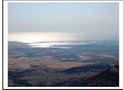
Foto 4. Enez Kasabası batısında yer alan Enez Körfezi, Dalyan, Bücürmene ve Taşaltı göllerinden bir görünüm.

Tuzlusu Ekosistemleri; Ege Denizi ile suları tuzlu ve kısmen tuzlu olan Dalyan gölü, Bücürmene gölü, Taşaltı gölü, Karagöl ve Tuzla gölleridir. Başta flamingolar olmak üzere birçok kuş türüne barınma ve beslenme ortamı sağlayan bu göller kuş gözlemciliği bakımından önemli çekiciliklere sahiptir. Bücürmene, Dalyan ve Taşaltı gölleri ise Dalyan balıkçılığı bakımından önem taşımakta olup amatör balıkçılık ve ornitolojik bakımdan çekicilikler sunmaktadır(Foto 4).