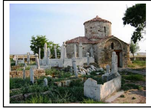
Foto 6. Has Yunus Bey Türbesinden bir görünüm.