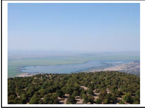
Foto 3. Gala Gölü(Küçük Gala ile birlikte)'nden bir görünüm. Arka planda kuzeydoğu-güneybatı yönünde akan Meriç Irmağı ve Yunanistan sınırları içerisinde yer alan Fercik(Fera) kasabası görülmektedir.

tarih 8547 sayılı Bakanlar Kurulu Kararı ile Milli Park ilan edilmiştir. 3 bin 90 hektarı sulak, 3 bin hektarı da ormanlık alandan meydana gelen Gala Gölü Milli Parkı, Türkiye'nin belli başlı ekolojik sistemleri içerisinde yer alan en önemli sulak alanlardan biridir. Biyolojik çeşitlilik rezervi ve doğaya katkılarıyla sayısız yararı bulunan sulak alanda 163 kuş türü, 42 bitki türü 19 balık türü yaşamaktadır. Kuşların göç yolları üzerinde bulunan Gala gölü kış göçmeni kuşların önemli barınma ve beslenme yeri durumundadır. Nesli tükenme tehlikesiyle karşı karşıya olan çok sayıda kuş türünü barındırmaktadır. Nitekim tepeli pelikan ( Pelecanus crispus) çeltikçi (Plegads falcinellus), küçük karabatak (Phalacrocorax pygmaeus) gibi nesli son derece azalmış türler ile zaman zaman Gala gölünü ziyaret eden ve nesli tehlikede olan balık kartalı ve akkuyluklu kartalı barındırması önemli bir çekicilik oluşturmaktadır. Bu kuşların birçoğu dünyada ve Türkiye'de nesilleri tehlike altında olan kuşlar listesinde yer almaktadır.