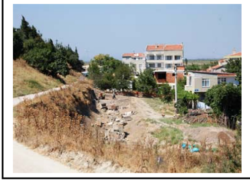
Foto 7. Antik Ainos kentinin en büyük mezarlığı olan Taşaltı nekropolü, kasabanın doğusunda ve Taşaltı gölünün kuzeyinde yer alır.