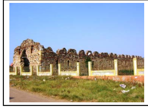
Foto 10. Sahil kervansaravından bir görünüm.