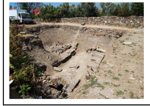
Foto 8. Roma dönemi kanalizasyon sisteminden bir bölümü.

Bir diğeri kol ise Enez Kasabası doğusunda ve Keşan istikametinde giden yol olup, bu yolun bir kolu kuzeye yönelerek Gala gölü kıyılarını takip eder ve yaklaşık 22 kilometre kuzeydeki Kypsela(İpsaladan) geçen Via Egnatia ile birleşir. Birçok yerde Meriç Irmağı'nın alüvyonları altında kaybolmuş olan yolun en iyi korunduğu yerlerden biri de Gala gölünün güneydoğusudur. Yaklaşık 6 metrelik genişlik gösteren yolun taşları birçok yerde bataklık altında kalmış, birçok yerde de çeltik kanalları ve düzenlemeler sırasında tahrip edilmiştir(Foto 9). Çok az bölümü izlenebilen yolun Enez turizmi için büyük öneme sahiptir.