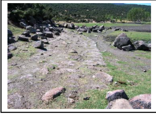
Foto 9. Gala gölü doğu kıyısında genişliği yaklaşık 6 metreye ulaşan ve Via Egnatia ile birleşen Roma yolu kalıntısından(yan yol) bir görünüm.

insanların ve turistlerin ekonomik, sosyal ve estetik ihtiyaçlarını doyuracak şekilde ve gelecek nesillerin de aynı ihtiyaçlarını karşılayabilecekleri biçimde yönetildiği bir kalkınma şeklidir(Özbey,2002).