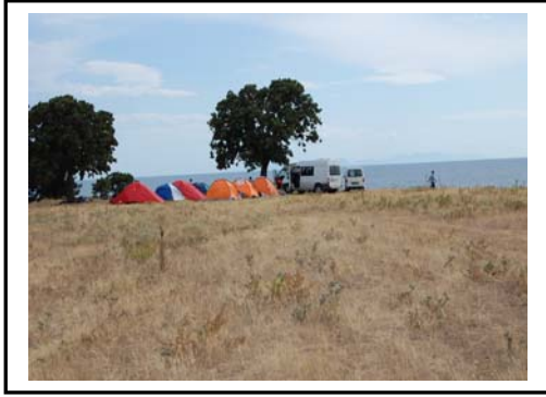
Foto 13. Karaincirli köyü kıyıları özellikle üniversite öğrencilerinin kamp alanı olarak tercih ettiği yerlerden biridir.

Bu turizm çeşidinin gelecekte, yörenin ekonomik ve sürdürülebilir turizm bakımından gelişmesine büyük yarar sağlayacaktır.