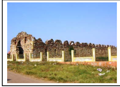
Foto 10. Sahil kervansaravından bir görünüm.