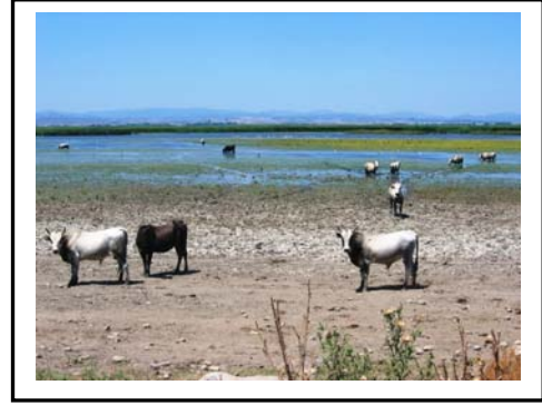
Foto 12. Gala gölü su kuşları yanı sıra büyükbaş hayvanlardan ‘‘yoz’’ hayvanların da yaz mevsiminde beslenme alanlarından biridir.

Eko turizm içinde «yaban hayatı gözlemek» ilgi çekici bir rekreasyon faaliyetidir. Karada ve suda yaşayan canlıları, kendi doğal yaşam ortamlarında bireysel veya daha küçük gruplarla gözlemek, incelemek, fotoğraf ve film çekmek için turlar düzenlenmektedir(Doğaner,1996:36). Gala gölü ve çevresi yaz mevsiminde çevre köylerde(Işıklı köyü başta olmak üzere) hayvancılık yapan bazı ailelerin yerli ırk olan ve yörede ‘‘yoz’’ olarak adlandırılan hayvanlarının da yaz mevsiminde beslenme ortamı durumundadır. Yarı vahşi olan bu hayvanlara kuşlar gibi yeterince yaklaşılammakta ve vahşi doğanın bir parçası olarak ilginç görüntüler oluşturmaktadırlar(Foto 12).