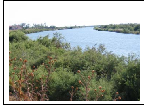
Foto 2. Meriç Irmağı'na ve dolayısıyla Yunanistan sınırına en yakın konumda yer alan Cumhuriyet İlköğretim Okulu ve Meriç kıyısındaki Iğnınlardan bir görünüm.