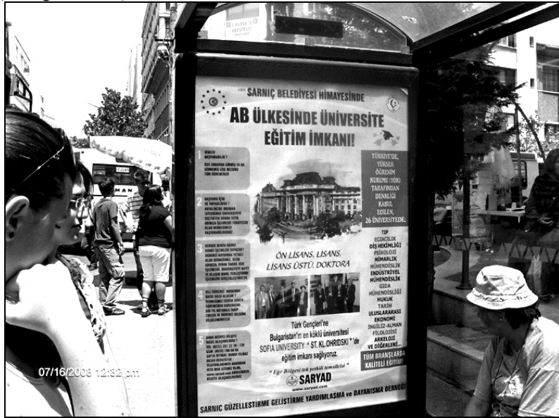
Fotoğraf 3 Çifte vatandaşlıkları bulunan Bulgaristan göçmenlerine yönelik Bulgaristan'da üniversite eğitim reklamları

Son yıllarda ortaya çıkan en yeni sınır-aşırı ilişkilerden birisi de eğitim ile ilgili olmaktadır. Türkiye'de üniversite sınavlarının zorluğunun aksine üniversite giriş sınavlarının çok daha kolay olduğu Bulgaristan'a pek çok öğrenci gitmiştir. Göçmenlerin Bulgaristan üniversitelerine olan bu ilgisi nedeniyle her yıl üniversite kayıtları başlamadan önce Bulgaristan'ın değişik üniversitelerinden görevliler belediye veya BAL-GÖÇ himayesinde Türkiye'ye gelerek okullarını tanıtmaya çalışmaktadırlar (Fotoğraf 3 – 4)