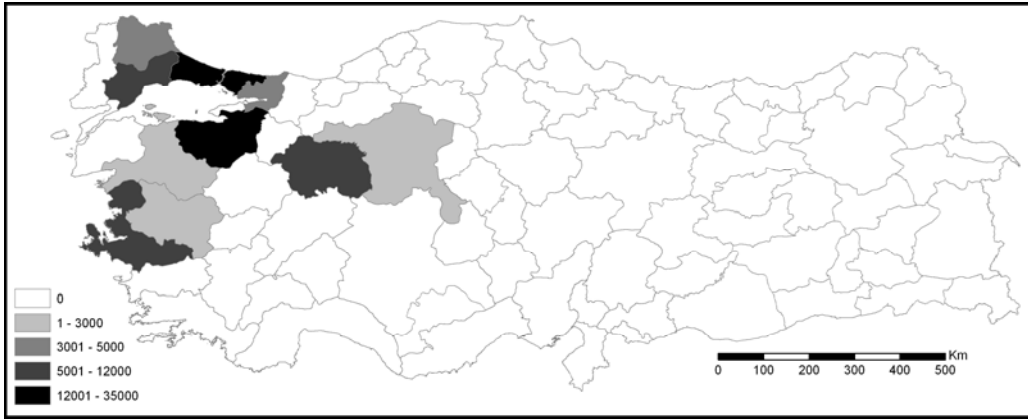
Harita 4 1952 – 1988 yılları arasında Bulgaristan’dan gelen göçmenlerin yerleşmek için tercih ettikleri ilk on il (bu dönemde Türkiye’ye gelen 116.521 göçmenden 116.140’ı 1969 – 1978 yılları arasında gelmiştir)