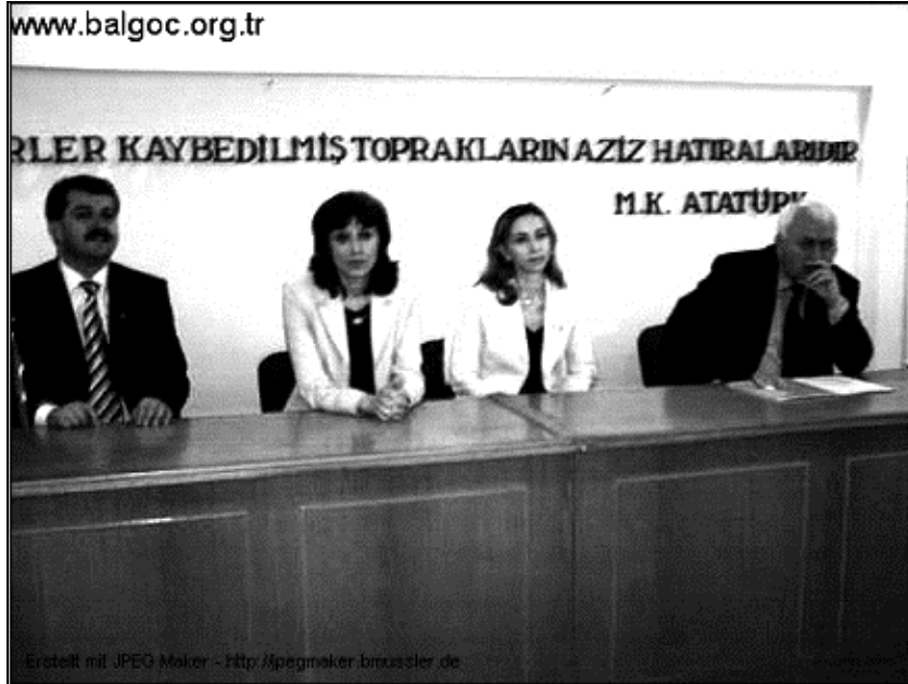
Fotoğraf 5 2005 Bulgaristan Genel Seçimleri öncesinde Hak ve Özgürlükler Hareketinin Türkiye'deki toplantısı

Günümüzde gittikçe artan bir şekilde en çok dikkati çeken gelişmelerden birisi de sadece İzmir'de değil neredeyse 1989 göçmenlerinin yoğun olarak bulunduğu bütün yerleşme alanlarında gelişen siyasal ilişkilerdir. 1989 göçmenlerinin büyük bir çoğunluğunun Türk vatandaşlığının yanı sıra Bulgaristan vatandaşlığını da taşımaları Bulgaristan'da bulunan siyasi partilerin ve özellikle de Hak ve Özgürlükler Hareketi partisinin dikkatini seçimler öncesi yürütülen kampanyalarda buraya yöneltmiştir. Seçim kampanyaları esnasında Hak ve Özgürlükler Hareketi milletvekili adayları Sarnıç'a gelerek göçmenlerden oy istemektedirler (Fotoğraf 5).