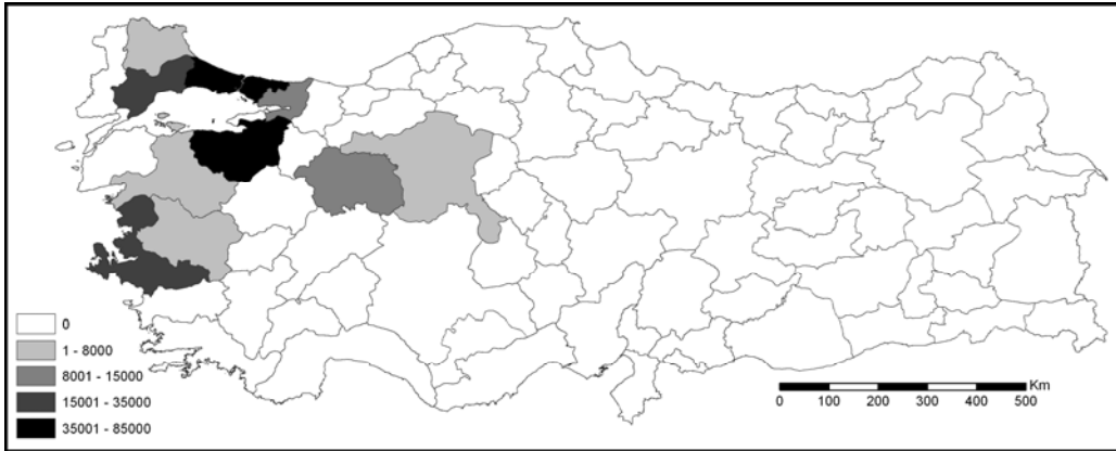
Harita 5 1989 yılında Bulgaristan’dan gelen göçmenlerin yerleşmek için tercih ettikleri ilk on il

Balkan göçmenlerin iskanı ile ilgilenen Köy Hizmetleri Genel Müdürlüğünden elde edilen veriler Cumhuriyet tarihi boyunca gerçekleşen göçlerin iskanında iller arasında büyük bir değişiklik olmadığını göstermektedir. Bununla birlikte günümüze doğru yaklaştıkça gelen göçmenlerin İstanbul, Bursa ve İzmir illerini yerleşmek için daha çok tercih edildiğini göstermektedir (Tablo 2). Bu durum