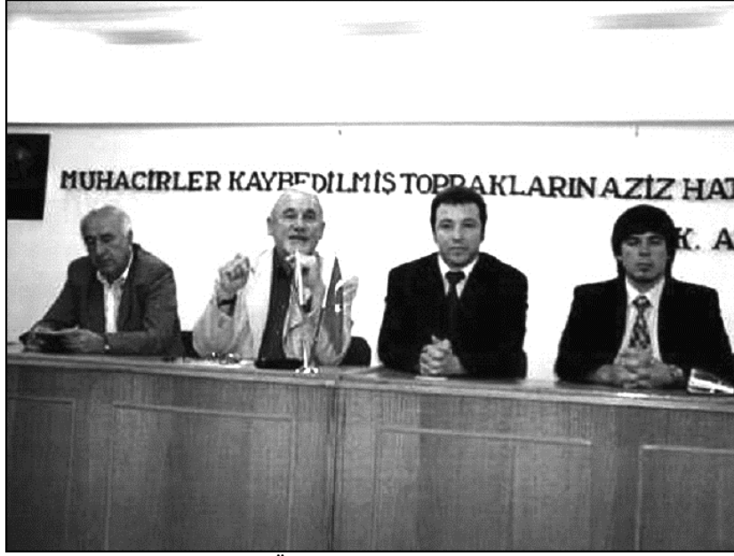
Fotoğraf 4 Sofya Teknik Üniversitesi'nin Türkiye'deki tanıtım toplantısı

Günümüzde gittikçe artan bir şekilde en çok dikkati çeken gelişmelerden birisi de sadece İzmir'de değil neredeyse 1989 göçmenlerinin yoğun olarak bulunduğu bütün yerleşme alanlarında gelişen siyasal ilişkilerdir. 1989 göçmenlerinin büyük bir çoğunluğunun Türk vatandaşlığının yanı sıra Bulgaristan vatandaşlığını da taşımaları Bulgaristan'da bulunan siyasi partilerin ve özellikle de Hak ve Özgürlükler Hareketi partisinin dikkatini seçimler öncesi yürütülen kampanyalarda buraya yöneltmiştir. Seçim kampanyaları esnasında Hak ve Özgürlükler Hareketi milletvekili adayları Sarnıç'a gelerek göçmenlerden oy istemektedirler (Fotoğraf 5).