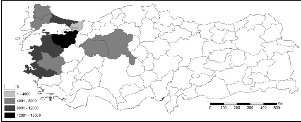
Harita 3 1950 – 1951 göçmenlerinin Türkiye’de en çok yerleştirildikleri ilk 10 il

Balkanlar’da gerçekleşen bu ilk göç dalgasının ardından meydana gelen diğer göç dalgaları ile gelenler de daha sonra bu illeri yerleşmek için tercih etmişlerdir. 1950-51, 1969-78 ve 1989 yıllarında gelen göçmenlerin de büyük oranda aynı illerde yerleştikleri görülmektedir (Harita 3, 4, 5).