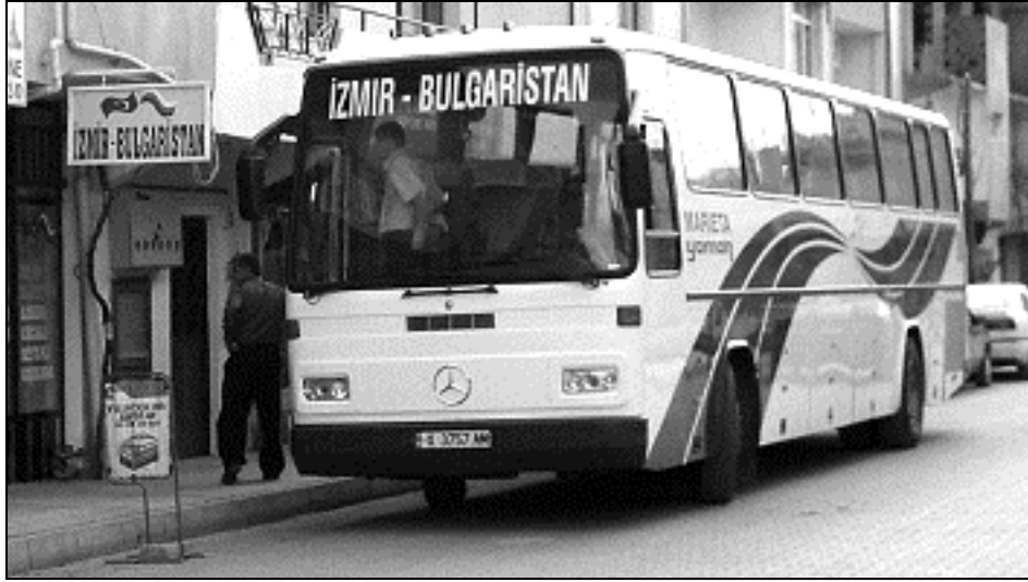
Fotoğraf 6 Türkiye – Bulgaristan arasında her gün otobüs seferleri düzenlenmektedir.

Sarnıç'tan da Bulgaristan'da Türklerin yoğun olarak yaşadığı bölgelere değişik otobüs firmaları her gün otobüs seferleri düzenlenmektedir (Fotoğraf 6).