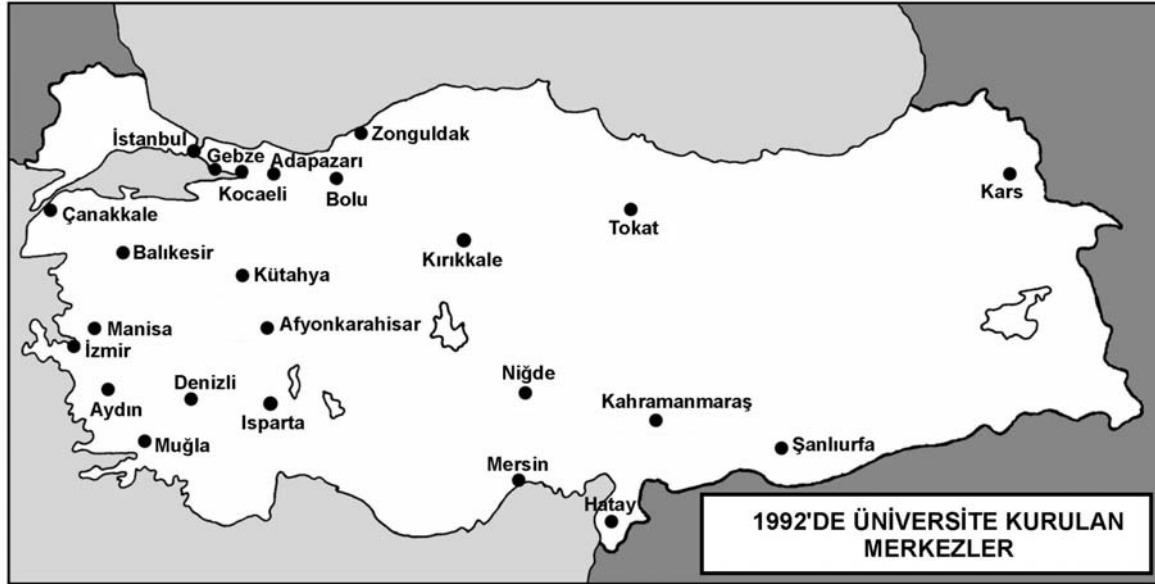
Şekil 1. 1992 yılında üniversite kurulan merkezler

sıra sanayi, ticaret, turizm gibi çok farklı ekonomik fonksiyonlara sahip olmaları, yoğun göçe maruz kalmaları üniversitelerin nüfus artışı üzerindeki etkilerini bir hayli gölgelemektedir. Başka bir ifadeyle, adı geçen kentlerin geniş alanları etkileyen farklı ekonomik işlemlere sahip olması onları geleneksel göç merkezleri haline getirmiştir. Bu nedenle, üniversitelerin kentin nüfus ve kentsel gelişmeye olan doğrudan etkisini ortaya koymak, bu tip kentlerde son derece güçtür.