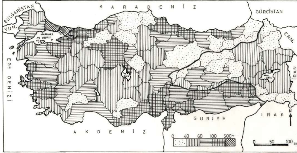
Şekil 2. Türkiye'de illere göre nüfus yoğunluğu (2000).

Malatya'da km 2 'ye 72 kişi düşmektedir. Bu bölge ortalamasının üzerinde bir değerdir (km 2 'ye 42 kişi). Nüfus yoğunluğunun en fazla olduğu ilçe Battalgazi (km 2 'ye 167), en az olduğu ilçe Arguvan (km 2 'ye 10)'dır.