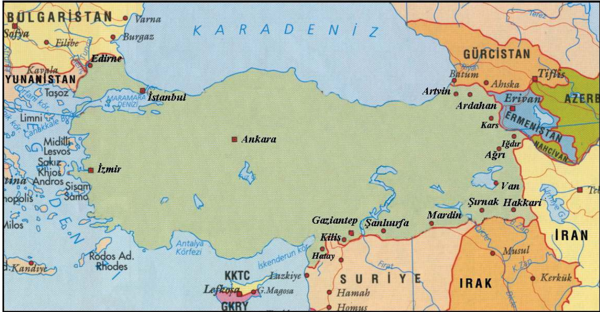
Harita 1. Sınır ticareti yapılan iller ve komşu ülkeler.

Ülkemizde Ağrı, Van, Hakkari, Artvin, Iğdır, Ardahan, Gaziantep, Kilis, Hatay, Mardin, Şanlıurfa, Şırnak ve Edirne illerinde sınır ticareti yapılmaktadır (Karabağ, 2005). Zaman zaman sınır ticareti yapılan illerin sayısı değişmekte ve komşu illerde bu kapsama alınmaktadır. Çoğunluğu Türkiye'nin Doğu ve Güney sınır illerinde sınır ticareti, bu bölgelerde yaşam standardını yükseltmek amacıyla yapılmaktadır.