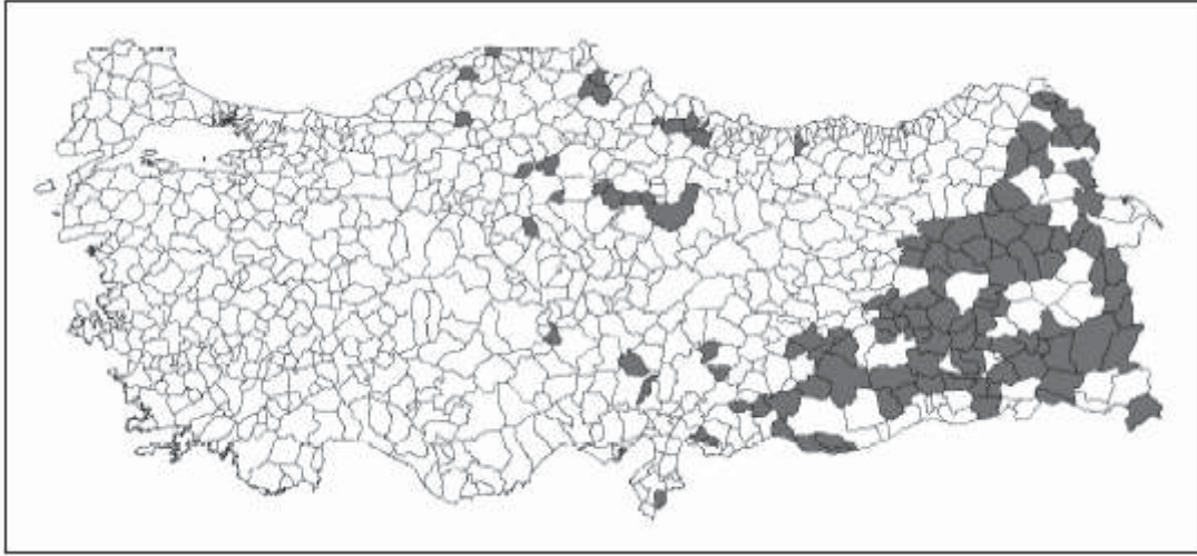
Harita 3. DPT verilerine göre altıncı derecede gelişmiş ilçeler (2004).

DPT'nin belirlediği gelişmişlik indeksi esas alındığında, sınır ticareti yapılan ilçelerin hemen hemen tamamı altıncı derece gelişmiş ilçeler grubunda yer alır (DPT, 2004). Altıncı grupta yer alan 119 ilçenin 93'ü ülkemizin doğu ve güneydoğu kesimlerinde yer almaktadır. Türkiye nüfusunun %6'sını oluşturan bu gruptaki nüfusun %86'sı sınır ticaretine izin verilen illerde yaşamaktadır. İstihdamın sektörel dağılımında %83,2'yle tarım sektörü başta gelir. Sanayi sektöründe ise %1,1 istihdam mevcuttur. Bu özellikleri ile altıncı grupta yer alan ilçelerdeki nüfus göç eğilimi en fazla olan gruptur. Bütün bu faktörler dikkate alınarak istihdam açısından çeşitliliğin olmadığı bu bölgelerde, sınır ticareti bir alternatif olarak kalkınmada önemli bir etken olabilecek unsurdur.